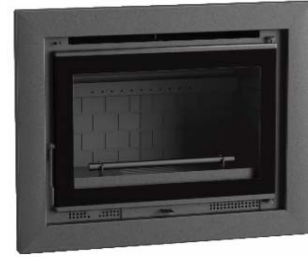
IT-165 F. Interior Fundición.